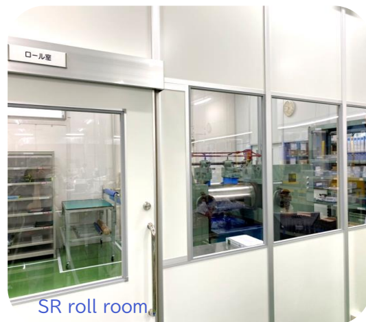
SR roll room