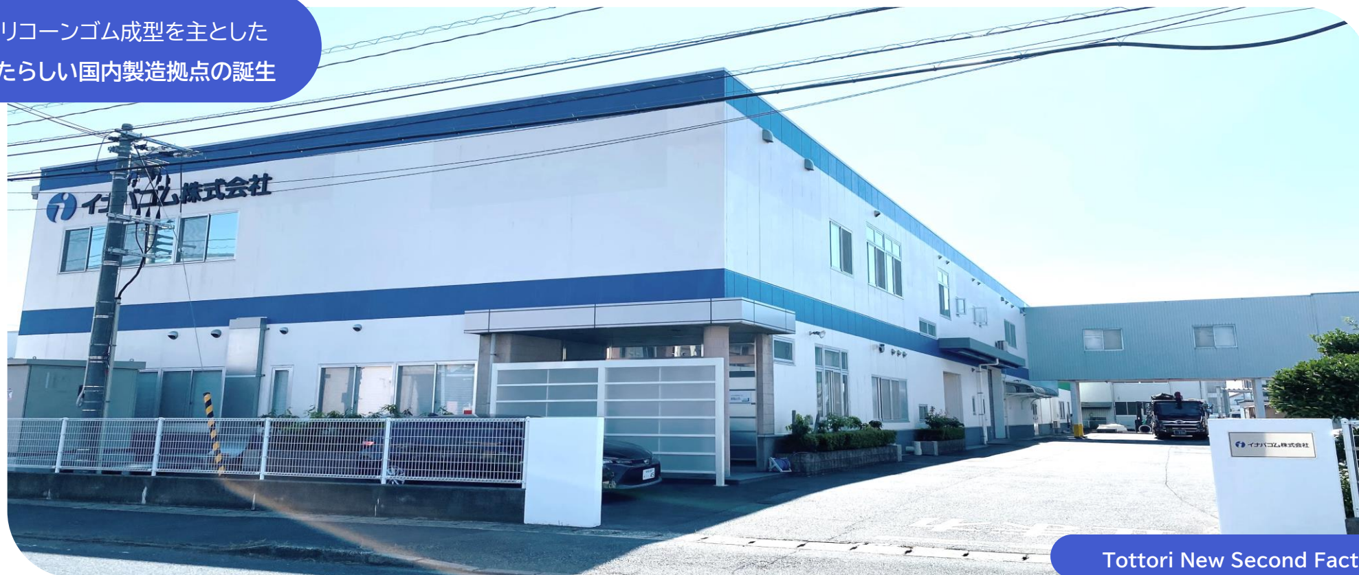
Tottori New Second Factory