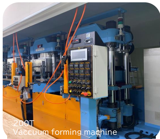
200T Vacuum forming machine

作業者の動線の無駄を減らし、安全かつ快適な職場環境でのものづくりを実施していきます。