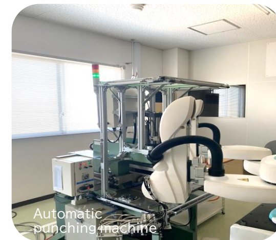
Automatic punching machine